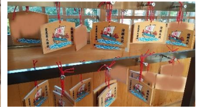
祈祷後にお渡しする絵馬に願い事を書いて金毘羅堂内にお掛け下さい